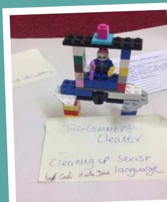
The Sexist Comment Cleaner

Lluniodd y plant fap meddwl o'r holl ffyrdd y mae'r cyfryngau'n creu ac yn herio stereoteipiau rhywedd. Yna, fe wnaethon nhw eu 'peiriannau chwalu stereoteipiau rhywedd' eu hunain gyda lego a nodiadau gludiog .