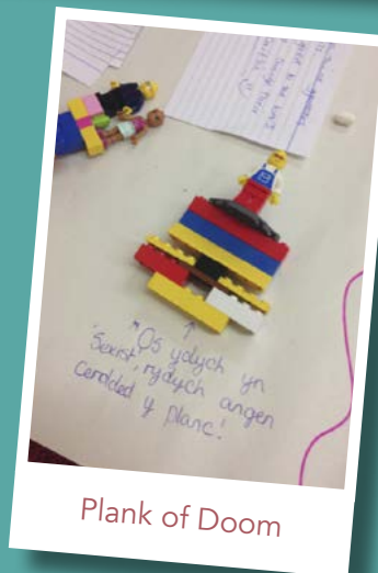
Plank of Doom